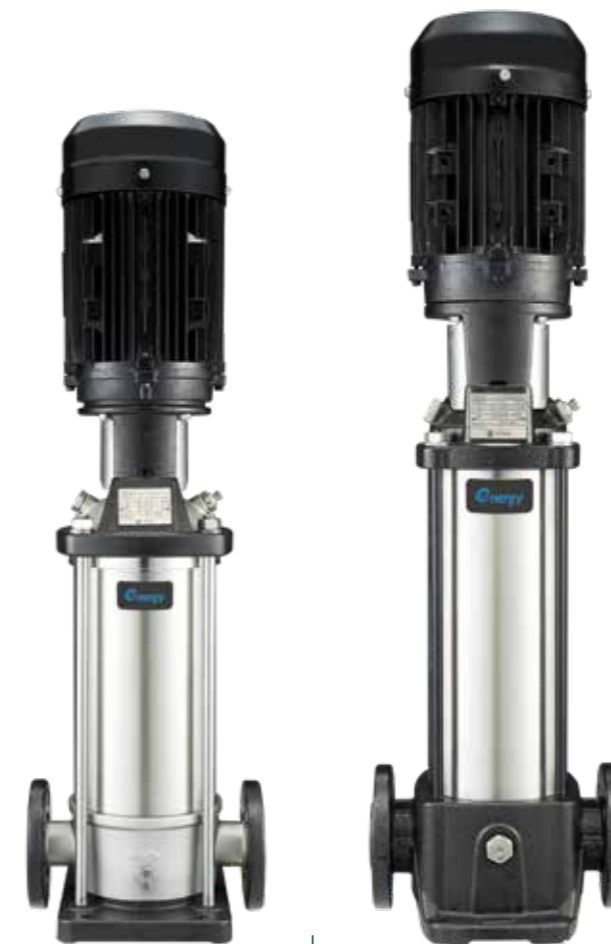
FULL INOX UP TO CVX 321

Caudal hasta Fördermengen bis Portate fino a 33 l/s Altura manométrica hasta Förderhöhen bis Prevalenze fino a 260 m Potencias hasta Leistung bis Potenze fino a 45 kW